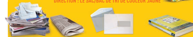
Journaux, magazines, revues, catalogues

DIRECTION : LE SAC/BAC DE TRI DE COULEUR JAUNE