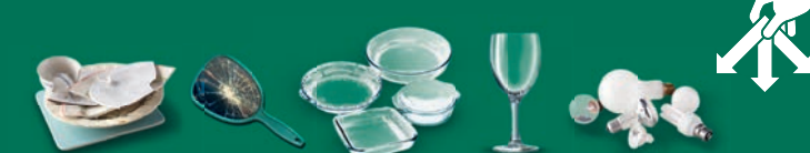
Vaisselle, céramique, pyrex, faïence, porcelaine, ampoules, vitres, miroirs, etc.