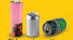
Bidons et canettes en acier et aluminium