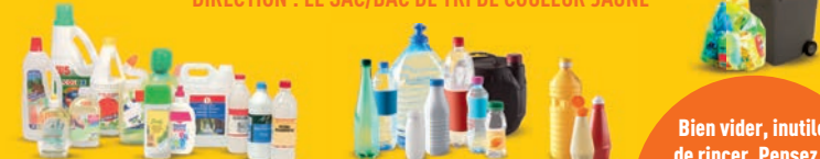
Emballages de produits d'entretien ménager

DIRECTION : LE SAC/BAC DE TRI DE COULEUR JAUNE