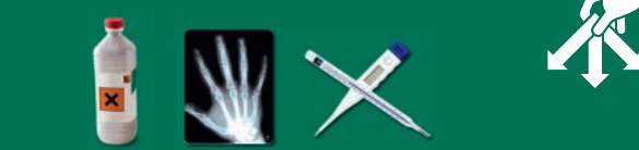
Produits chimiques, radiographies, thermomètres