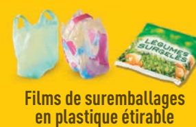
Films de suremballages en plastique étirable