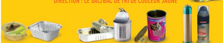
Barquettes en aluminium

DIRECTION : LE SAC/BAC DE TRI DE COULEUR JAUNE