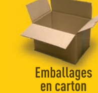
Emballages en carton